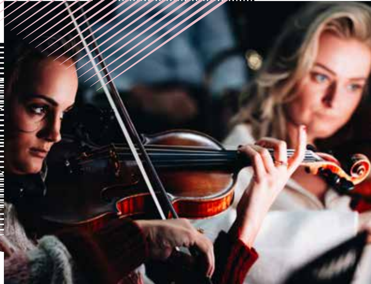
Strijkenssectie Noordpool Orkest

Noordpool Orkest werkt met een klein team van professionals: die de organisatie draaiende houden: een artistiek leider, een zakelijk leider, een productie-leider / financieel medewerker, een marketing-medewerker en een directie-assistent. Dankzij de uitbreiding van ons (nog altijd zeer bescheiden) kernteam en de komst van ons kantoor in Kunstwerf is er meer continuïteit, rust en bestaanszekerheid qua organisatie gerealiseerd in de afgelopen jaren.