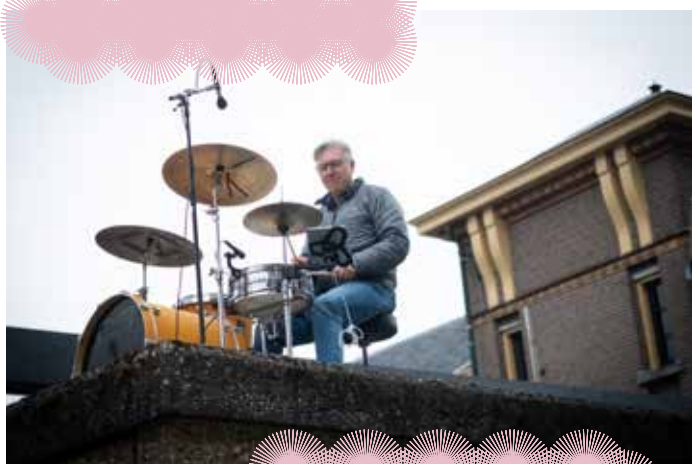
Opening Kunst- werf Groningen

In een samenleving waarin steeds meer online en in de cloud wordt gewerkt, biedt de VOA app een open source-achtige constructie waarin muzikanten van alle niveaus, leeftijden en uit alle windstreken op laagdrempelige wijze kunnen uitwisselen en co-creëren.